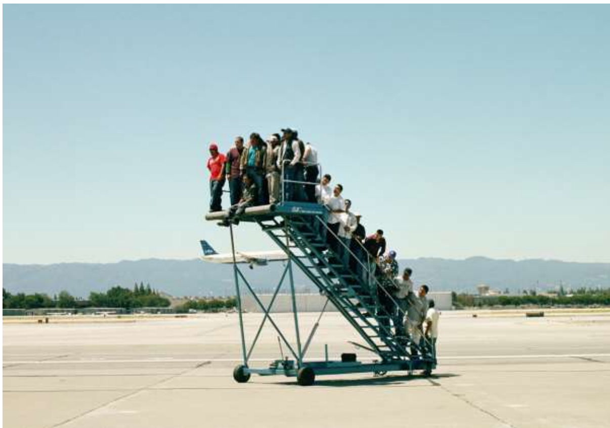
Kungl. Konsthögskolans årsredovisning 2016